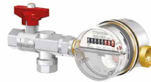
■ NFE 2.1