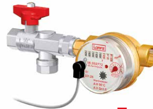
■ NFE 2.2