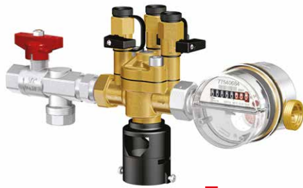
■ NFE 1.1